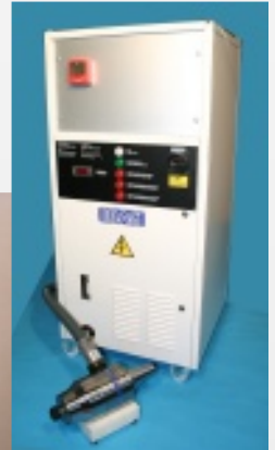
HFK 135 Komplettsystem mit Versorgungseinheit 35