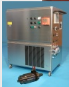
HFK 90 Komplettsystem mit Versorgungseinheit 20