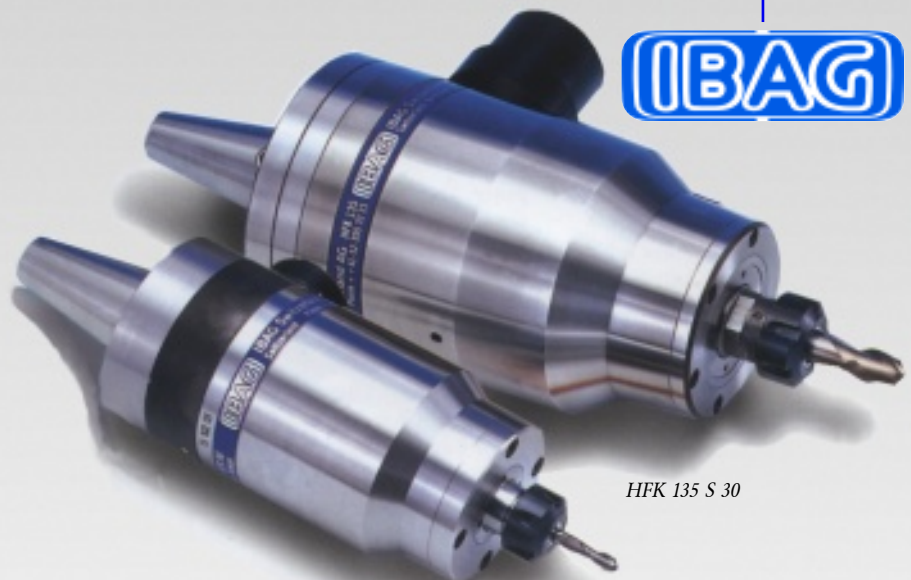
HFK 135 S 30