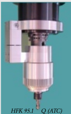
HFK 95.1 Q mit automatischer Kupplung zum Einwechseln aus dem Werkzeugmagazin (ATC)