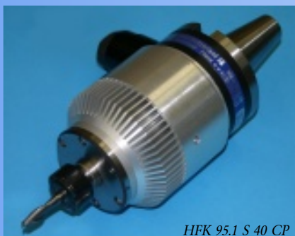
HFK 95.1 S 40 CP